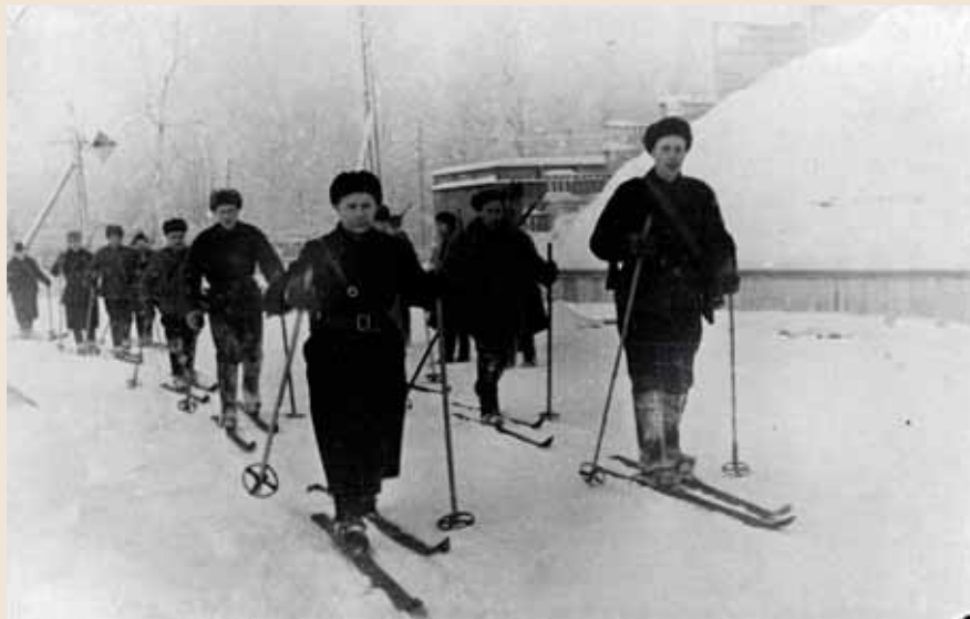
Группа советских лыжников-подрывников на марше. Зима 1943 года.