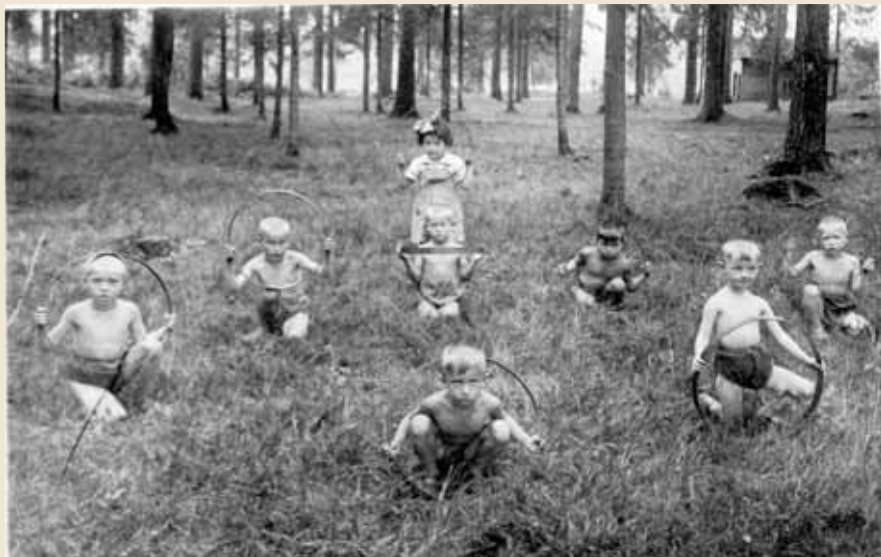
В детском саду. Я во втором ряду первый слева

чал: «Вы что! Вдруг самолеты налетят!» Пришлось еще померзнуть, пока мать ходила договариваться насчет жилья. Хорошо помню укрытый памятник Ленину. Я тогда еще подумал: «Что это за гора такая?»»