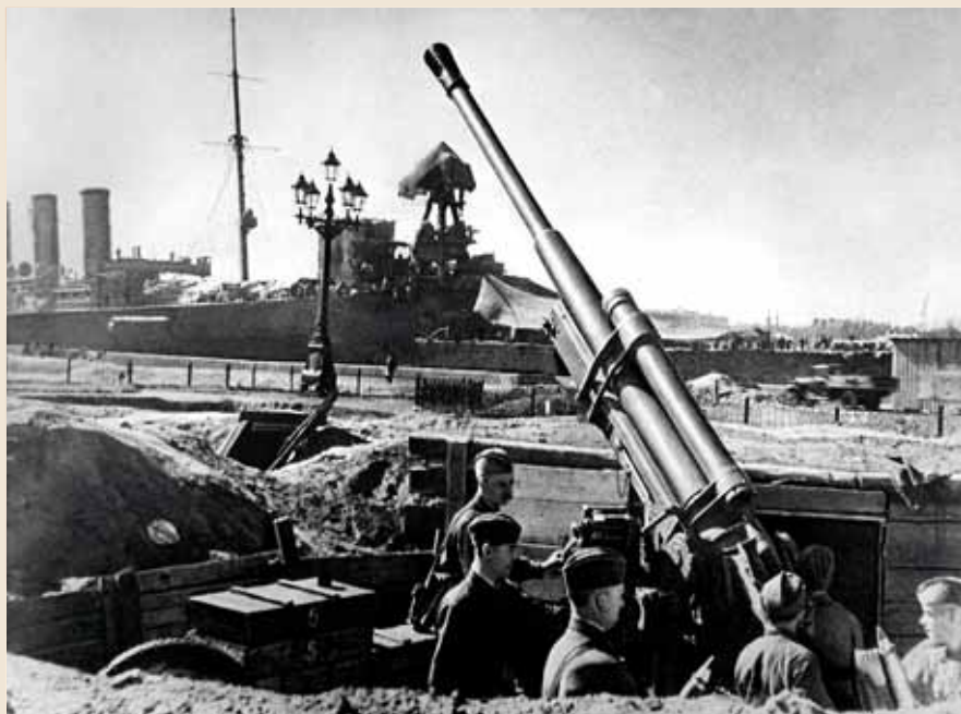
Советская 85-мм зенитная пушка 52-К образца 1939 года на набережной в Ленинграде

забирали и увозили, но мертвецов было так много, что отряды дружинников — в них были, в основном, девушки — просто не успевали. Все трупы свозили к братским могилам.