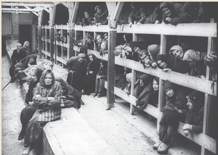
Узники концлагеря Озаричи Гомельской области. 1941–1942 гг.

бую малую провинность, не говоря уже за попытку бежать, за то, что пытались пролезть через колючую проволоку за едой. Немцы забирали провинившегося человека в будку и избивали его до полусмерти. Мой брат несколько раз попадал в будку. Его там так сильно избивали, что отбили внутренние органы.