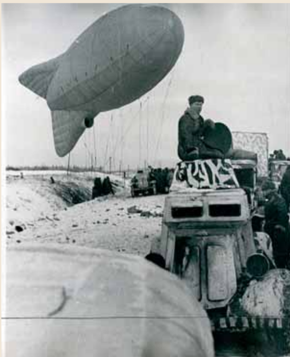
Запуск аэростата наблюдения (внизу привязана гондола, в которой уже находится экипаж). Ленинградский фронт.

После войны нам не жилось легко. Маме платили небольшую зарплату. Сейчас я не могу сказать, сколько именно. Правда, она получала 27 руб. пенсии на двоих за папу, но в 1945 году к нам из Старой Руссы перебралась