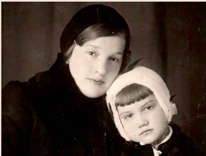
Я с мамой. 12.05.1941 г.

Автономной Республики Коми и Ненецкого национального округа (последний в то время был частью Архангельской области). В обязанности инспекции входило, в частности, осуществление технического надзора за состоянием судов, их постройки и ремонтом, прием судов; обеспечение безопасности плавания. В условиях войны все это становилось особенно актуальным. В течение года отец несколько раз бывал в длительных командировках.