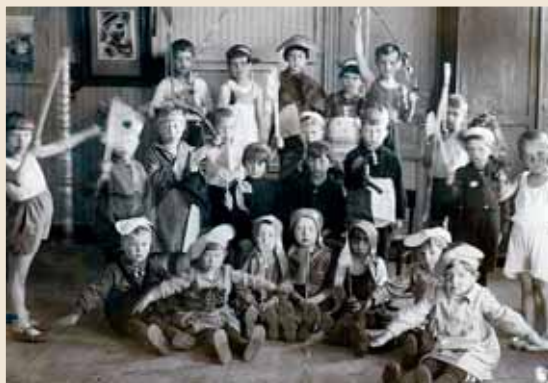
В детском саду. Первый слева в первом ряду.

ном направлении. Однако уже 19 июля войска группы немецкой армии «Север» под командованием фельдмаршала Лееба возобновили наступление и вынудили наши войска отойти на прежние рубежи. Тем не менее гитлеровцам не удалось добиться поставленной цели — с ходу окружить со-