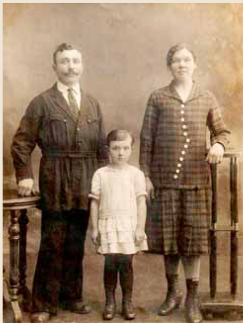
С родителями перед войной