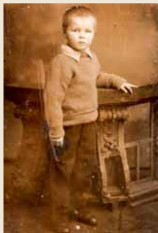
Перед поступлением в школу

Радиоприемник, а также три охотничьих ружья отца пришлось сдать на хранение. Я всегда интересовался сообщениями Информбюро, которые зачитывал диктор Юрий Левитан (один из трех «врагов» Гитлера). Обстановку на фронтах северо-западного направления отмечал на