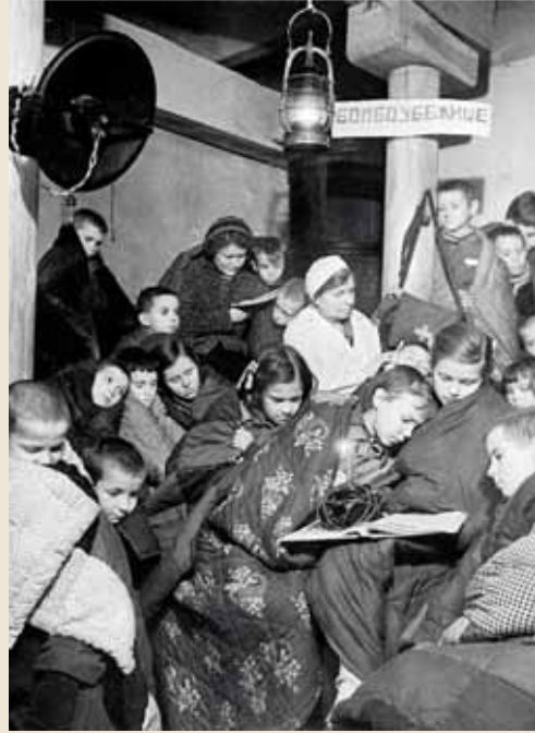
Ленинградские дети в бомбоубежище во время налета немецкой авиации

И так 9 мая 1945 года мы приехали в послевоенный город и прожили 3 дня на Московском вокзале. А потом мама устроилась на завод «Красный выборжец». Жить мы стали в общежитии на пр. Мечникова — в 146-й школе, на 4 этаже, там у нас с мамой была одна кровать на двоих. Все продукты тогда выдавались по карточкам (хлеб, крупы, сладости). Этого не хватало. Хлеб приходилось покупать. Мама давала мне 30 рублей, и я ходила к больнице Мечникова, к ларьку, у которого можно было за деньги купить хлеб (его продавали студенты, которым присылали продукты из деревни), и просила: «Тётя, не продадите ли хлеб?» Иногда удавалось купить. Часто с ребятами ходили к Пискаревке, потому что там находилось овоще-