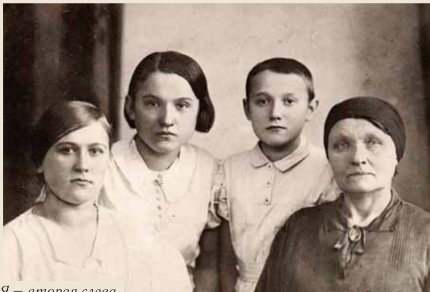
Я – вторая слева