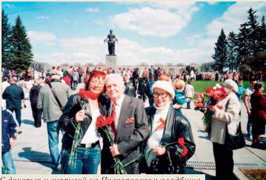
С дочерью и супругой на Пискаревском кладбище

жался парашют. Все было в порядке, и я по команде инструктора покинул самолет. Через 10–15 секунд полета в воздухе я дернул кольцо и раскрыл парашют. Не рассчитав высоту, я освободился от парашюта слишком поздно, и когда упал на воду, надо мной оказались стропы и часть моего парашюта. Оказавшись в такой ситуации, я понимал, что время играет не в мою пользу, и надо очень быстро принимать правильное решение. Не поддаваясь панике, набрал как можно больше воздуха и нырнул в сторону от парашюта.