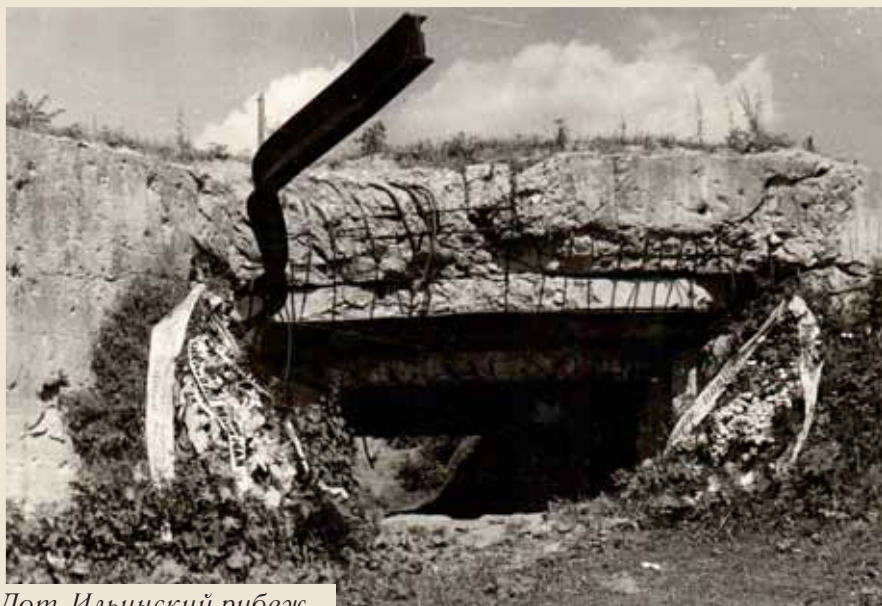
Дот. Ильинский рубеж