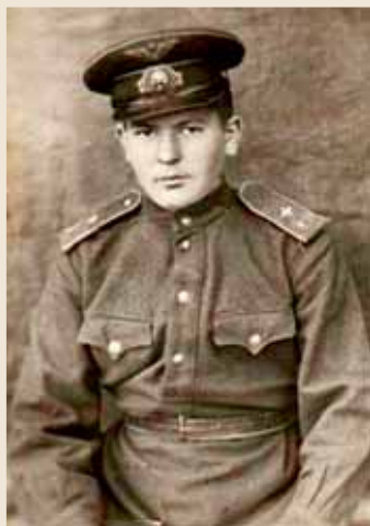
Челябинское авиационное училище, 1943–1944 гг.

Шел ноябрь 1943 года — время для всей страны тяжелое. Мой родной Ленинград находился в глубокой блокаде, на фронтах шли ожесточенные бои. Мы сдавали врагу город за городом, и даже Москва находилась на грани падения.