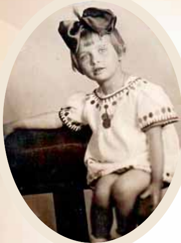
Фото сделано в первый день войны.

Мама пошла работать во Дворец пионеров, который не эвакуировался. Мыла посуду и полы, а я оставалась одна и готовила какую-то еду. Мама ночью уходила и ночью приходила. Чтобы мне было не так тоскливо, она для меня где-то подобрала котенка. Такого же страшного, какими были мы, такого же голодного.