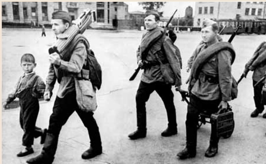
Красноармейцы с пулеметом «Максим» идут по улице Ленинграда

Испытательный срок прошел, и меня приняли на работу. Я пользовалась большим уважением среди жильцов, отработала паспортисткой полтора года.