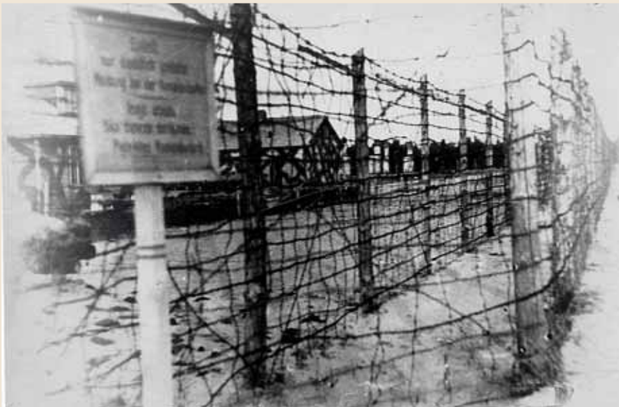
Проволочные заграждения перед территорией немецкого концлагеря Саласпилс

Один из местных жителей не испугался и спрятал нас на своем хуторе в погребе. Запомнилось только одно: дикий холод от сырой земли и ожидание, что нас схватят. Погреб был покрыт травой, поэтому немцы, прочесавшие весь лес в поисках беглецов, нас не нашли. Было страшно, что выдаст хозяин, потому что к русским в Прибалтике относились плохо. Но никто нас не выдал, в погребе мы дождались прихода наших войск.