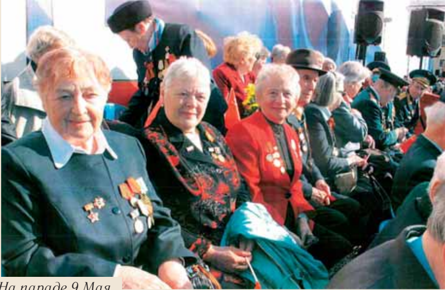
На параде 9 Мая

ему отнести поесть»... Ненавидеть я их стала позже. Тогда я этого не понимала.