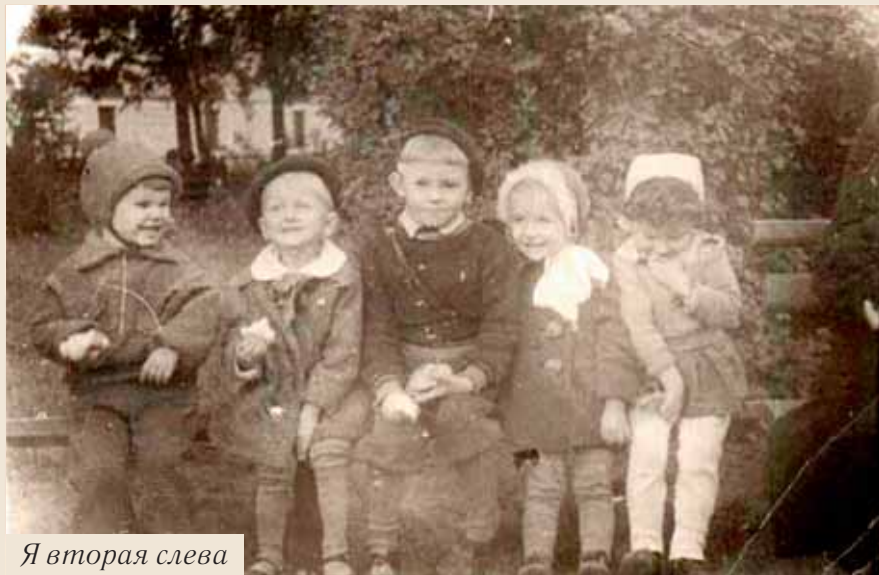
Я вторая слева